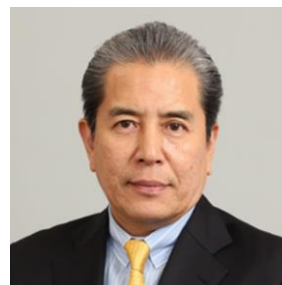
前船橋市税務部 参事兼債権管理課長 株式会社シンク サービス事業推進部部长