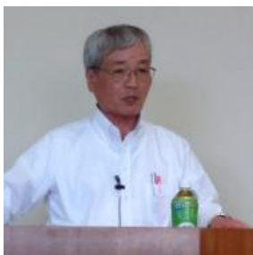
会津若松市非常勤特別職 一般社団法人日本経営協会 専任講師